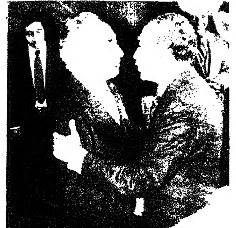
الرئيس السادات لدى لقائه مع شيمون بيرس

ومن ناحية اخرى صرح الدكتور طربس غالي لراسل صوت اسرائيل باللغة العربية في القامورة امس انه لا توجد خلافات جوهرية بين موقف مصر وموقف حزب العمل الاسرائيلي من ضم الفلسطينيين والاردن الى مفاوضات الحكم الاداري الذاتي وان الخلافات القائمة هي ثانوية وان الهدف هو هدف مشترك وهو العمل من اجل استجاب السلام في المنطقة والتوقيع من التفاوض والاتصالات الدبلوماسية حتى يمكن التوقيع على جميع المعاهدات .